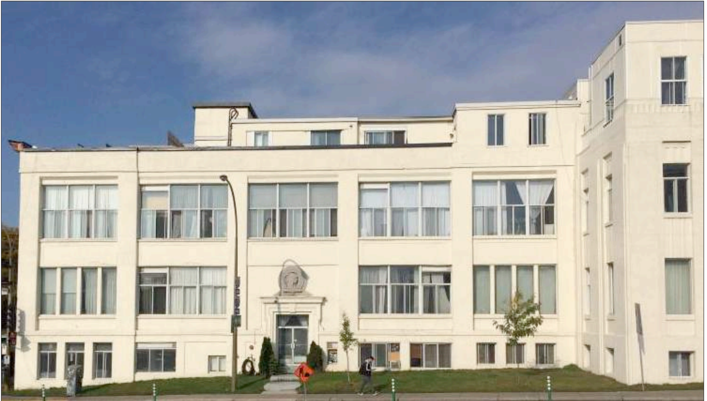
Complex ASN a l'anlge de Maisonneuve et Décarie.