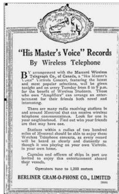
Montreal Gazette, 30 Novembre, 1920

En 1926, Herbert produisit une autre innovation à l'enregistrement soit : l'enregistrement en direct des émissions radiophoniques à des fins de re-