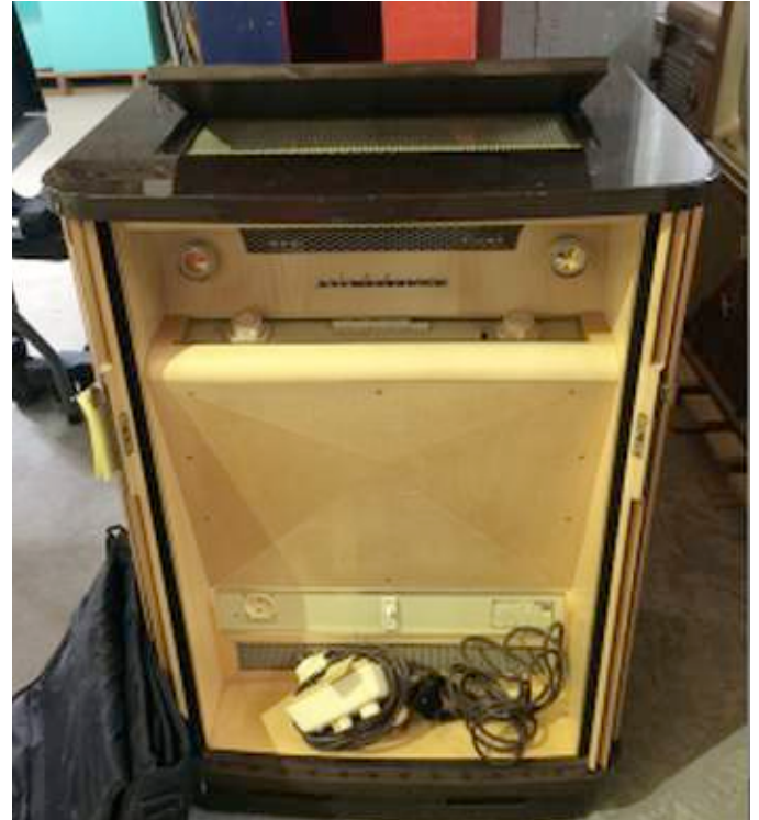
En haut: Le system Saba avec commande à distance En bas: une famille regarde leur system Telerama

Le prix de vente de 3 000 deutschemark pour l'ensemble ciblait uniquement les personnes très riches.