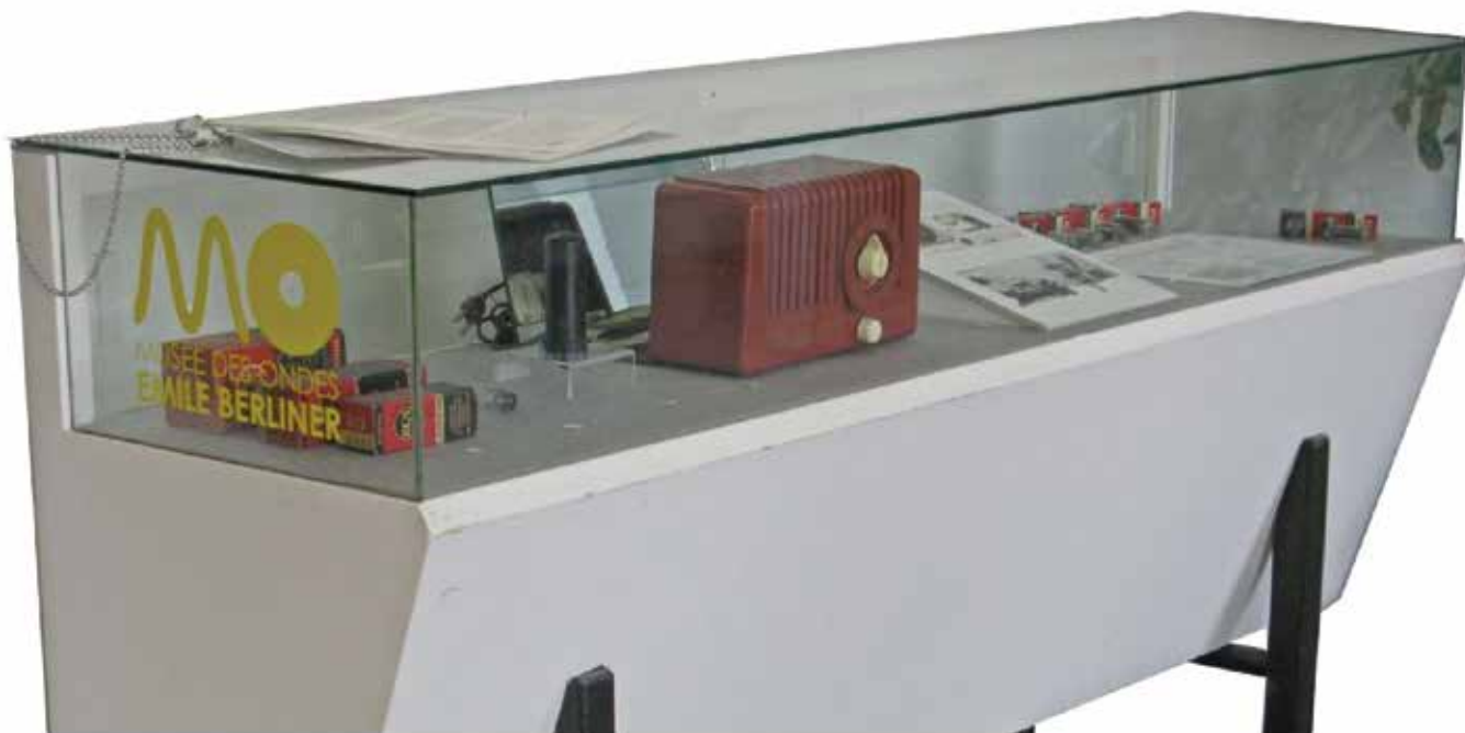
vitrine de l'entrée de la rue Lacasse, présentant une radio RCA

Trois autres vitrines sont placées à proximité de notre nouvelle salle d'exposition, à côté du restaurant Zin-Zin, au coeur du complexe RCA. Ces vitrines vont présenter Emile Berliner et ses nombreuses interventions sociales et internationales. Enfin, à la sortie de chacun des quatre étages de l'ascenseur principal de la rue Lacasse, nous préparons des vitrines qui vont montrer la relation entre la scène musicale montréalaise et l'évolution des équipements de reproduction musicale.