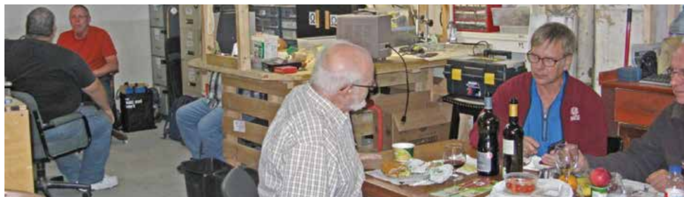
Petite pause pour les «Vieilles lampes»