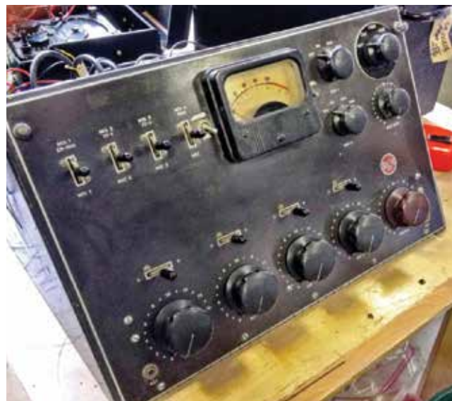
Réparation d'une console RCA

Occasionnellement nous réparons des appareils de l'extérieur moyennement une contribution monétaire au fonctionnement du Musée.